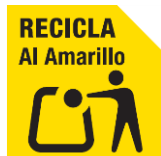
LÁMINA DE ALUMINIO